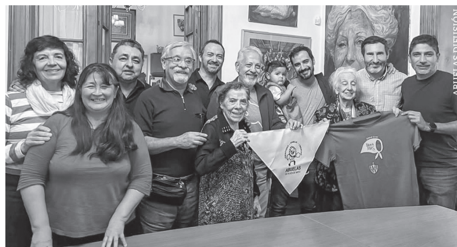
Abuelas y Atlanta durante el encuentro.

En medio de las políticas de ajuste del Gobierno de Milei, que alcanzan a las