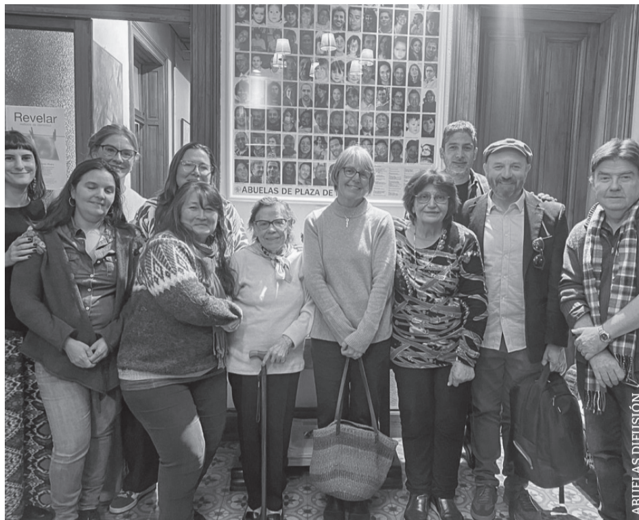
La delegación uruguayaya en Abuelas.