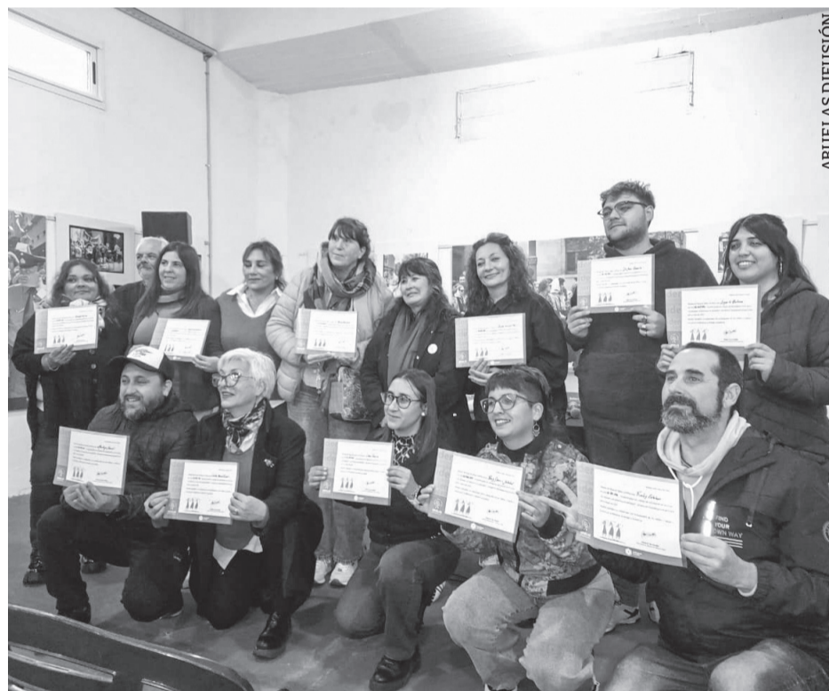
Egresados del curso.

En seis aulas virtuales —súper fáciles de navegar— se inscribieron 565 personas, la mayoría a través los municipios de Hurlingham, Moreno, Almirante Brown, Lomas de Zamora y Quilmes, y de la Asociación del Personal Legislativo (APL), del Sindicato de Prensa de Buenos Aires (SIPREBA) y de la Agrupación Federal de Funcionarios de la Universidad de la República (AFFUR) del Uruguay. Dieciséis tutoras y tutoras, responsables de las distintas áreas de Abuelas e integrantes de la Comisión Directiva, acompañan el trayecto formativo de la capacitación, leyendo las intervenciones de los participantes, realizando devoluciones e