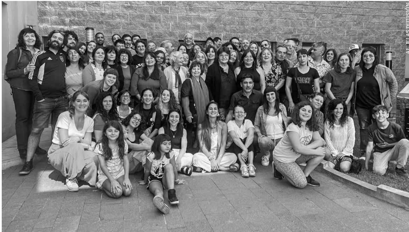
La gran familia de Abuelas.

Gracias a la ayuda de la Fundación Front Line Defenders realizamos un encuentro para reunir fuerzas y planificar el 2025.