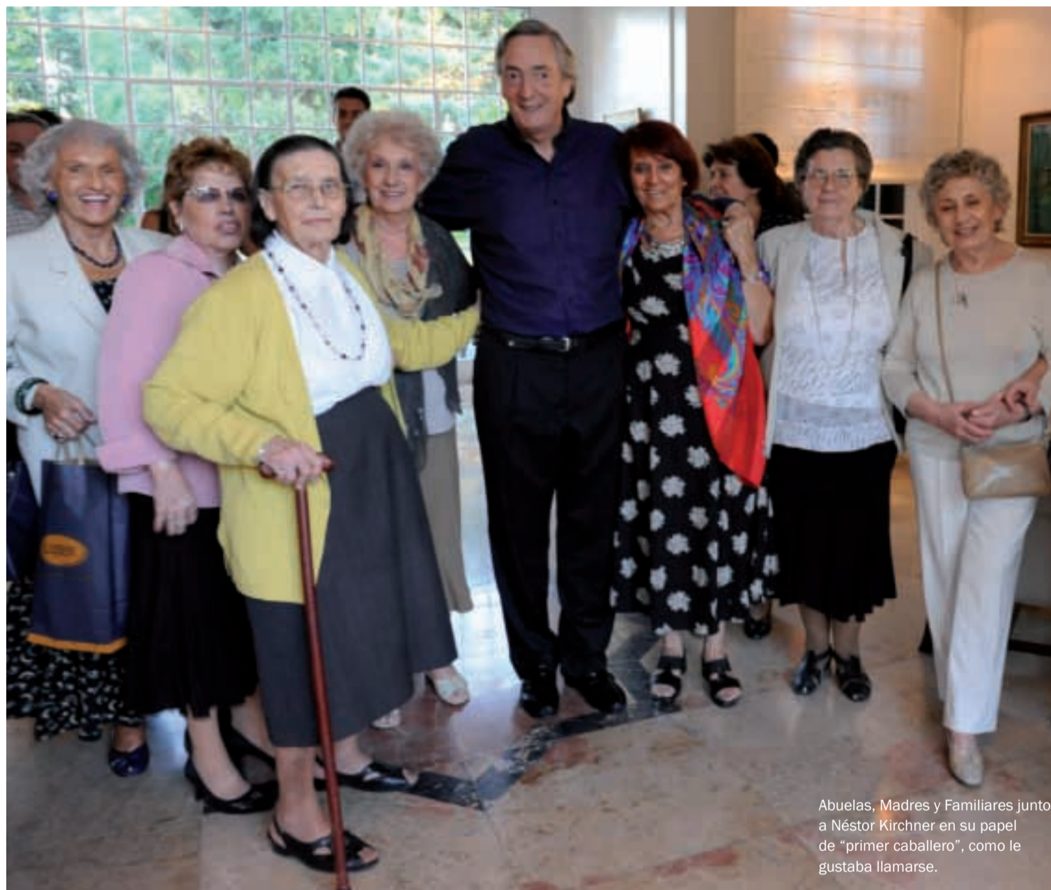
Abuelas, Madres y Familiares junto a Néstor Kirchner en su papel de "primer caballero", como le gustaba llamarse.

LAS ABUELAS SIGUEN LLORANDO A NÉSTOR KIRCHNER. QUEDA SU RECUERDO IMBORRABLE, SU ESTILO FRONTAL Y LIBRE DE EUFEMISMOS, SU COMPROMISO CON LAS VÍCTIMAS Y LOS DESPOSEÍDOS. HOY EL PUEBLO ABRAZA A LA PRESIDENTA CRISTINA FERNÁNDEZ, SU COMPAÑERA DE TODA LA VIDA.