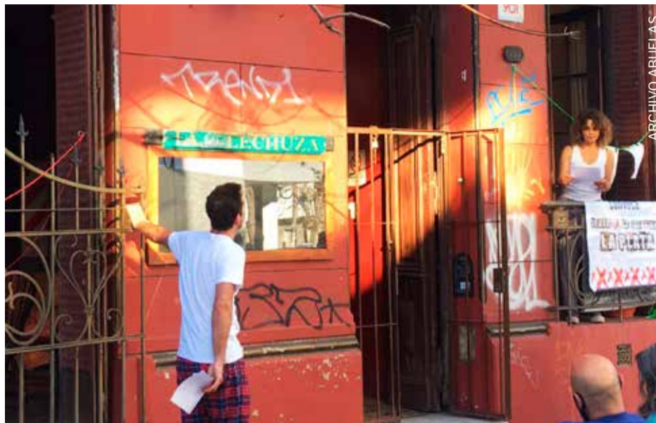
"Paquita, la del bandoneón", una de las piezas del ciclo.