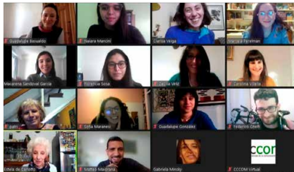
El acto de cierre del proyecto.

“Este proyecto condensa lo que creo que tiene que ser el sentido de las carre-