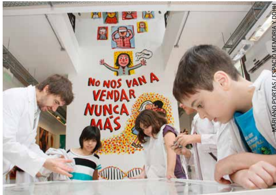
Vuelven las escuelas a la Casa por la Identidad.