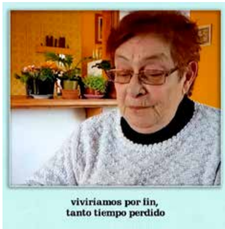
viviríamos por fin, tanto tiempo perdido