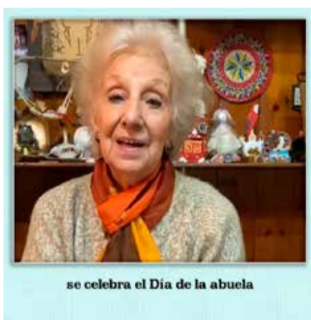
se celebra el Día de la abuela