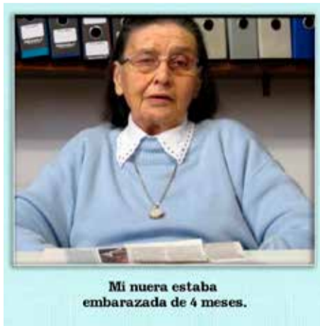
Mi nuera estaba embarazada de 4 meses.