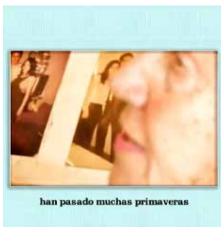
han pasado muchas primaveras