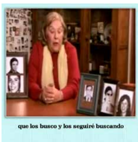
que los busco y los seguiré buscando