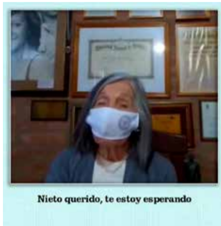
Nieto querido, te estoy esperando

El 26 de julio, Día de la Abuela, y durante toda la semana, invitamos a la gente a postear sus recuerdos con la suya para continuar con la búsqueda de las y los nietos que todavía nos faltan.